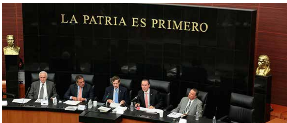
Comisión de Educación de la Cámara de Senadores.

En cuanto a la transparencia, el director general del Inifed dijo que por indicaciones del secretario de Educación Pública, Aurelio Nuño Mayer, se creará un portal en el que se publicarán los montos a ejercer, número de beneficiarios, y avances físicos.