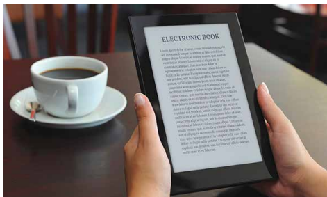
Foro La industria editorial digital en México.