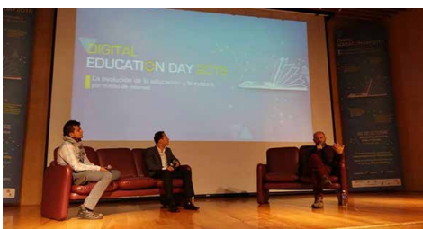
Foro La industria editorial digital en México.

“Este evento representa para nuestra Asociación la oportunidad de reunir las experiencias de todos los actores de este ecosistema, que incluye a quienes tradicionalmente participan en el mundo editorial, pero involucra además a profesionistas técnicos e innovadores del entorno digital, quienes aportan una forma diferente de acercarse al conocimiento”, agregó el presidente de AMIPCI.