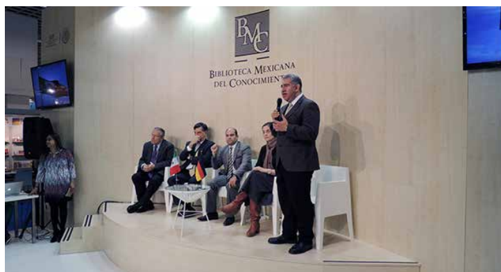
Biblioteca Mexicana del Conocimiento en Fráncfort.

Ya identificadas las obras, establecer un convenio con las dependencias, en materia de derechos de autor, para la traducción o impresión y distribución de estos libros. La BMC cuenta con un acervo de 65 títulos distribuidos en 12 colecciones, todos ellos exhibidos en Frankfurt y, al término de la Feria, entregados al Consulado de México en esa ciudad alemana que, a su vez, lo hará llegar a diversas instituciones luego de una revisión de los títulos y de acuerdo con las áreas de interés.