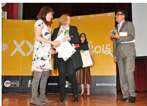
Entrega del premio Barco de Papel.

Aseguró que el CONACULTA, a través de la DGP, seguirá apoyando a la Fundación SM en la entrega de estos premios y se sumó a las felicitaciones por los 20 años de los mismos. “Felicitó a todos los ganadores que estos años han nutrido un catálogo ya indispensable para la literatura infantil y juvenil en español”, apuntó.